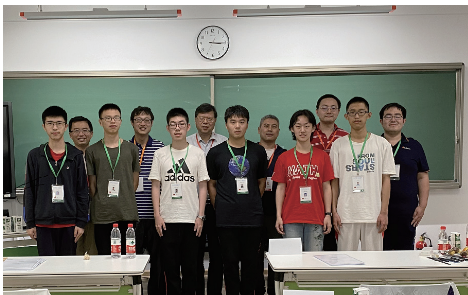
中国队队员及领队、副领队、观察员在考场