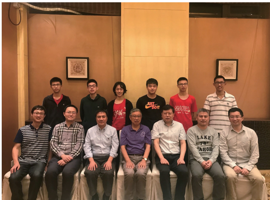
中国数学会理事长田刚院士会见中国数学奥林匹克国家队