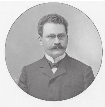
闵可夫斯基 (1864-1909), 德国数学家

告，伯克霍夫（Birkhoff）是他的好朋友，讲座结束之后，就问他最近在普林斯顿大学有没有什么有意思的东西。莱夫谢茨说有一个人刚刚证明了四色猜想。伯克霍夫严重地不相信，说要是这是真的，就用手和膝盖，直接爬到普林斯顿大学的 Fine Hall 去。Fine Hall 是普林斯顿大学的数学楼。