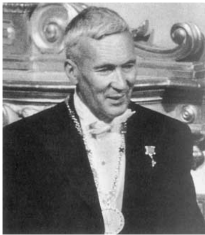
柯尔莫哥洛夫 (1903 - 1987)，二十世纪最伟大的数学家之一，也是冯康最佩服的数学家。

尽管冯康留苏的大部分时光都是在病榻上度过的，然而对数学有着敏锐嗅觉的他却很快地捕捉到苏联数学研究领域最活跃的分支——广义函数。