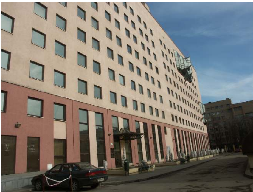
冯康曾于上世纪五十年代留学莫斯科斯捷克洛夫数学研究所

16日，华罗庚留下一封慷慨激昂的万言长信，毅然带领家人回到祖国。“梁园虽好，非久居之乡……为了国家民族，我们应当回去。”至今，这些铿锵的话语仍回响在许多爱国学子的耳旁。