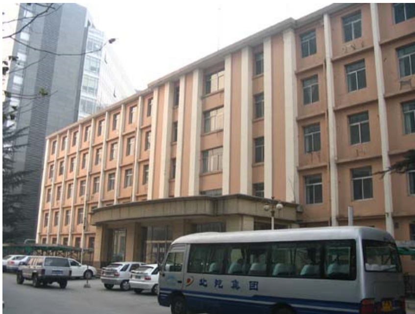
见证了中国最早的计算机诞生和计算数学发展的计算所北楼，在一片拆迁的风声中也未能幸免。它已于2009年正式消失了。

冯康在三室倾注了大量的心血，三室的实践也滋润了冯康的学术思想。在三室拼搏的日与夜，让冯康和他的同事们创造了事业的第一个巅峰。