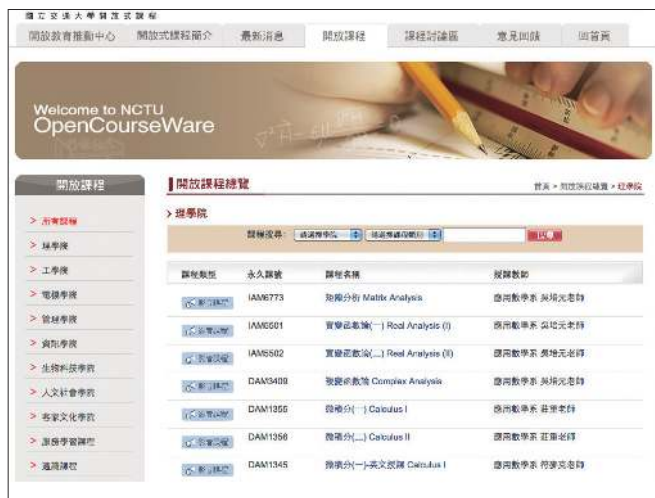
图 4 台湾国立交通大学数学开放课程