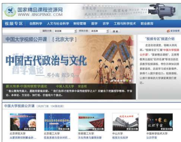
图 3 国家精品课程网站