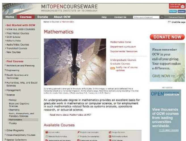
图 2 麻省理工学院数学开放课

后新浪、搜狐等网站也竞相推出自己的公开课网站, 互联网上出现了公开课热。台湾在 2008 年成立了台湾开放式课程联盟 (TOCWC), 目前已有 27 所大学参加。其中台湾交通大学开放了大量大学数学课程 (图 4)。除大学和政府机构外, 专业公司也是大学视频课程制作的主力军。国内的超星公司制作了五千多位名师的六千多门学术讲座和大学视频课程, 其中包括了很多数学讲座与大学数学课程 (图 5)。