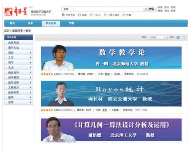
图 5 超星学术视频教学课程