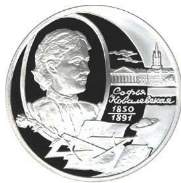
图 4 柯瓦列夫斯卡娅的纪念币: 其中刻有土星和光环, 以纪念她在 1874 年向哥廷根大学提交的博士论文中所研究三个问题之一的土星环问题

或许我们不能说我们对女数学家们了解很多。在参观前述展览时我就很惭愧地发现我对其中一些女数学家也所知甚少。比如曾为解决希尔伯特第十问题而作出过突出