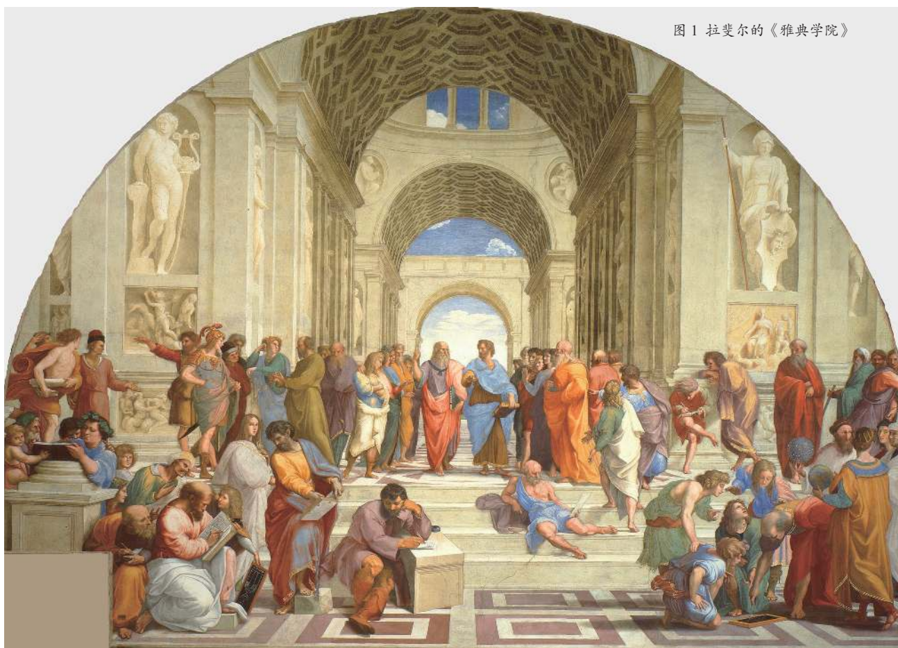
图1 拉斐尔的《雅典学院》