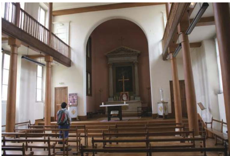
路易大帝中学的小教堂