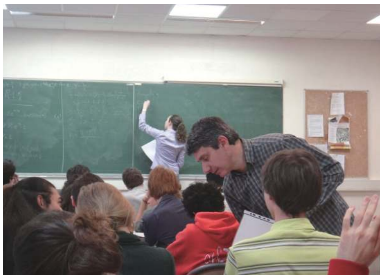
工科的数学分析复习课