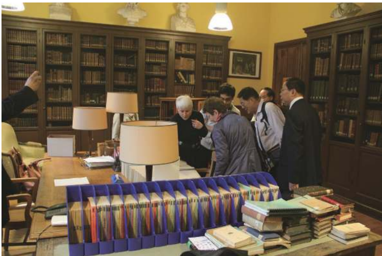
自豪的图书管理员

中，路易大帝中学的合格率为 99% 左右，其中三分之一能够留在本校的预科班；学校百分之百的预科毕业生能够考取高等学校，其中至少三分之一考入著名的巴黎综合理工学院，而该校每年有四分之一入校生来自路易大帝中学的预科。网上的统计数字显示，在 2006 年，巴黎高等师范学校数学物理科入学考试的第 1, 2, 3, 8, 9 名，数学物理信息科的第 1 名（中国学生），和物理化学工程科的第 1, 3, 4, 7,