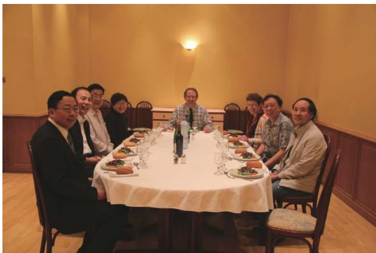
与安老师共进午餐