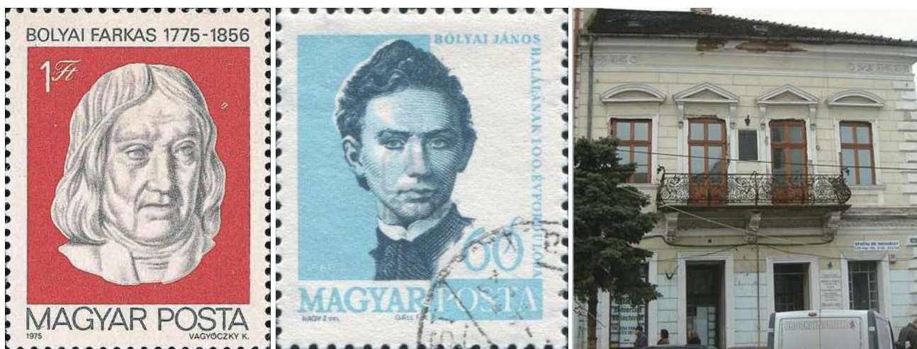
匈牙利分别于1960年与1975年发行的纪念鲍耶父子的邮票及他们的故居

主义学院（Calvinist College）教书；和当时的传统相似，父亲除了教数学外，还充当物理和化学老师。父亲希望自己的儿子成为一名数学家，并也沿着这个方向作出努力。同时，父亲认为光有一个智慧的大脑还不够，健康的身体发育应该是更重要的。所以小鲍耶小时候是德智体全面发展，这也为他成年后成为职业军人打下了良好的身体基础。