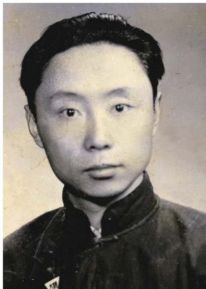
闵嗣鹤于西南联大

尽管如此，闵嗣鹤在这里却如鱼得水。西南联大数学系是藏龙卧虎之地，为我国现代数学研究做出过奠基性贡献的华罗庚、陈省身、许宝騄都在这里工作，号称数学系“三杰”；清华、北大、南开三个数学系的系主任杨武之、江泽涵、姜立夫也在这里，联大数学系则先由江泽涵，后由杨武之负责。闵嗣鹤置身于一个前沿、开放的学术氛围之中。他为陈省身讲授的黎曼几何担任助教，与陈先生结下了终生的友谊，陈先生晚年在给他的题词中写到：“1938年在昆明西南联大，我们曾对几何学有过共研之雅。”他为华罗庚组织讨论班，当年的学生徐利治晚年回忆：“有闵先生做他的助教，给他帮了不少忙。”华罗庚的“堆垒素数论”开讲时，慕名而来的学生很多，以至满堂座无虚席。之后听众一天天减少，减到最后只剩下四人听讲。又过了一个礼拜，四人减为两人，教室中留下了师生三人上课。在昆明天天有日本飞机空袭的日子，这两个学生索性搬到华家附近，租屋而居，以便就近到他家里上课。这两个人就是闵嗣鹤与钟开莱。他们认真阅读了华罗庚的手稿，并帮他做了一些修正与改进。华罗庚的名著《堆垒素数论》原拟1941年在