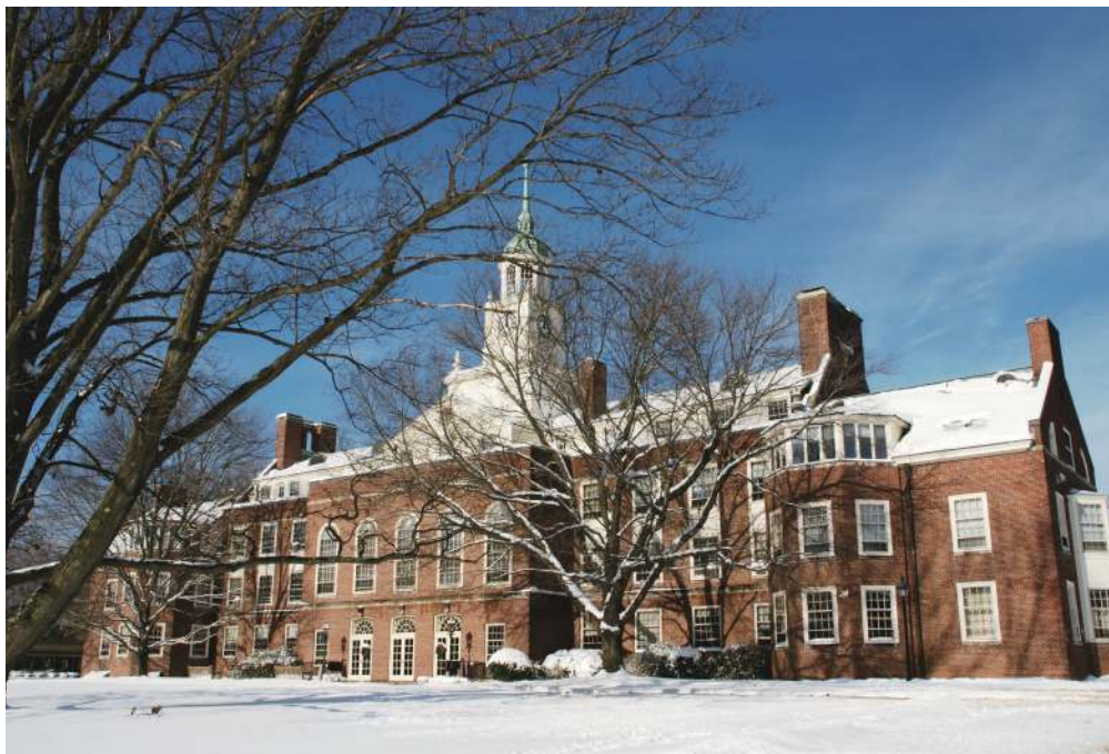
高等研究院 Fuld Hall 雪景