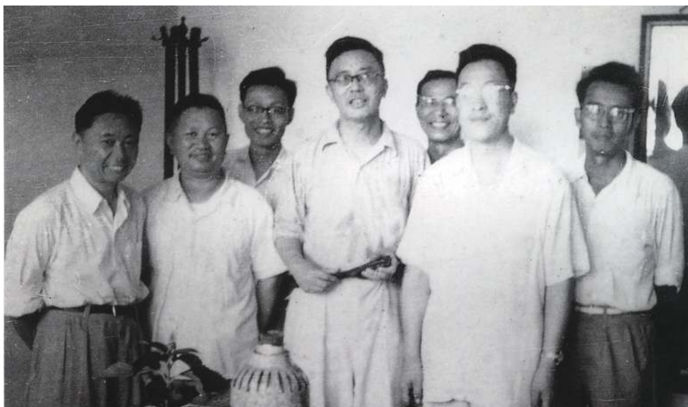
1950年代，闵嗣鹤（左一）与华罗庚（左四）等合影

有深刻的应用。值得指出的是，经过众多数学家的努力，闵嗣鹤的亚凸性上界不断被改进，但是现在的世界纪录仍然大于 \frac{1}{7} 。