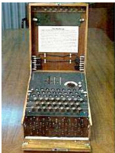
二战时德军的恩尼格玛机

图灵及团队根据波兰提供的信息，成功地破解了德军“恩尼格玛机”（Enigma machine）以及其它密码系统发出的密码。毫无疑问，图灵等人的成功改变了这场战争的结果，也改变了历史。