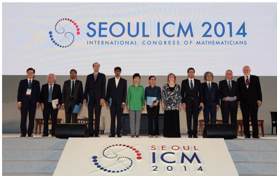
菲尔兹奖颁奖礼，中间三位女性从左至右：韩国女总统朴槿惠、玛利亚姆·米尔扎哈尼、国际数学家联盟主席英格丽·多贝西