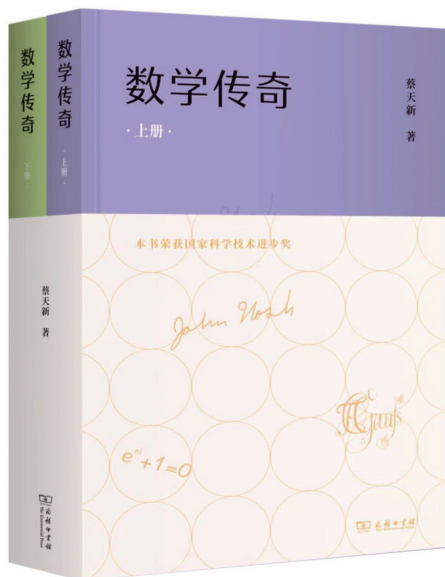
《数学传奇》(上、下册), 商务印书馆, 2022年11月