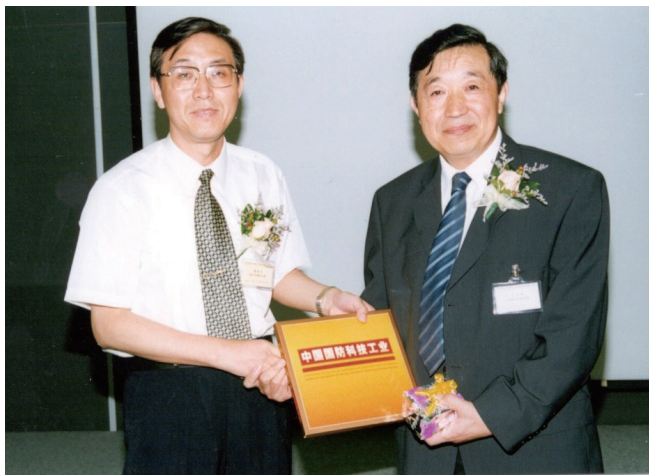
方开泰和刘永才（我国第一代陆基巡航导弹总设计师，2008 年国家科技进步特等奖获得者）

健性，试验次数灵活，很快在航天、化工、制药、汽车制造、科学研究等领域得到广泛应用。之后，方老师和他的研究团队发展完善了均匀试验设计的理论，该项目获得 2008 年国家自然科学二等奖（是年一等奖空缺）。