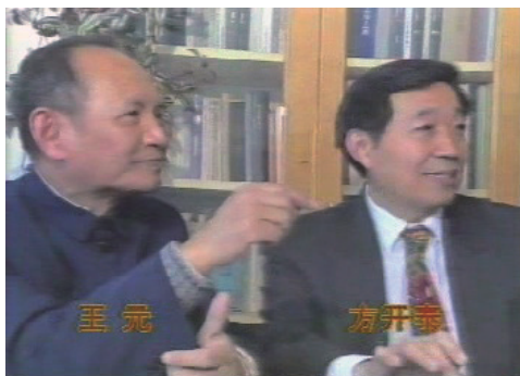
方开泰教授和王元院士，中央电视台，1994年

由于新中国工农业发展的迫切需要，1971-1975年，方老师积极投入到正交试验设计的普及活动中。他发明了正交试验设计的“直观分析法”，通过图表的方式使工程师更容易理解正交试验设计的思想和数据分析 1 。1976年，中科院数学研究所指定方老师负责中央电视台一个报道和宣传推广正交设计的节目，为了让统计方法能被更多的观众接受理解，他花了大量的时间准备道具和讲解稿。最终，中央电视台在晚间“新闻联播”后的黄金时间足足用了17分钟来介绍正交试验设计。因为准备充分，节目达到了很好的推广效果。