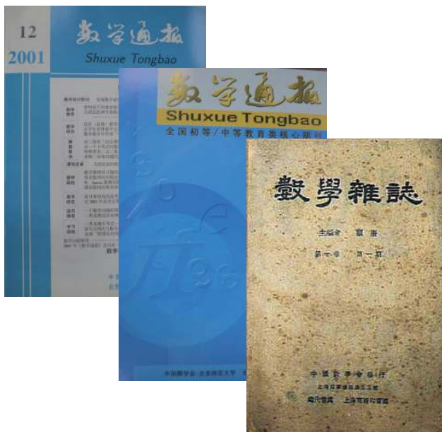
从左至右：图 3，图 4，图 5

可惜《中国数学杂志》这个珍贵的刊名只用了五期。由于中国科协领导的物理、化学、生物刊物都叫通报，为一致起见，《中国数学杂志》从 1953 年起改名为《数学通报》（图 3 和图 4），请郭沫若（曾任政务院副总理、中国科学院院长）题写了刊名。1966 年 8 月因“文化大革命”停刊，1979 年